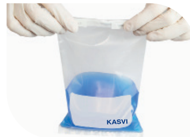
Dobrar o final das abas para fechar o saco

Imagens meramente ilustrativas. Produtos não passíveis de regulamentação na ANVISA.