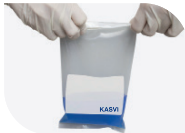
Dobrar as abas com os fios de ferro pelo menos 3 vezes