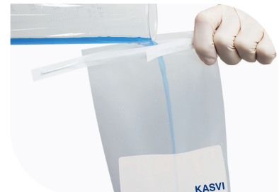
Colocar a amostra dentro do saco