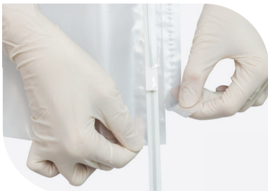
Destacar a parte superior do saco ao longo da linha tracejada